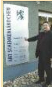
Neuer Wind im Rathaus S. 6-7