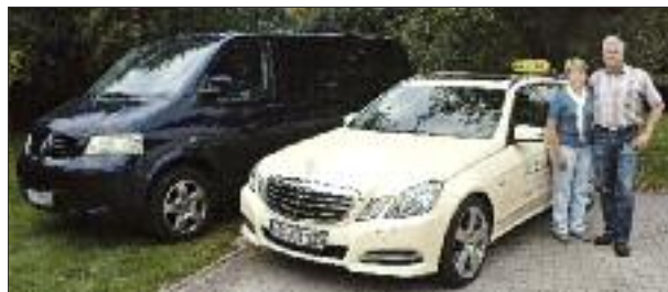
■ Das Taxiunternehmen der Eheleute Brandt verfügt über sichere und moderne Fahrzeuge.