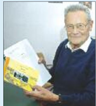
■ Nach der Veröffentlichung des ersten Buchs deckten die Bürger den Ortschronisten mit vielen weiteren interessanten Details aus der Geschichte ein.