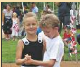
■ Fastnacht und Rosenfest sind die Domäne des Vereins von Groß Körös.