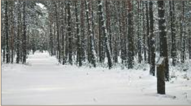
■ Die Lesefährte durch den Wald soll erweitert werden.

wagt sich an die Übergänge und Gelenke zwischen den einzelnen Künsteln und überschreitet Grenzen.