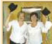
100 Jahre Fastnacht S. 14-16