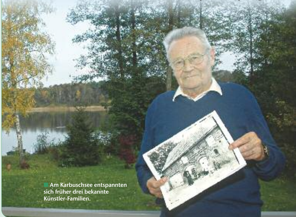
■ Am Karbuschsee entspannten sich früher drei bekannte Künstler-Familien.

Sein historisches Interesse ist ein Hobby, das er sehr akribisch betreibt. „Man muss oft auf persönliche Erinnerungen und private Schriftstücke zurückgreifen. Das ist sehr interessant. Aber man muss immer vorsichtig sein. Nicht alles, was früher niedergeschrieben wurde, hält einer späteren Überprüfung stand.“