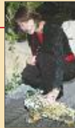
Tropen-Urlaub S. 18-20