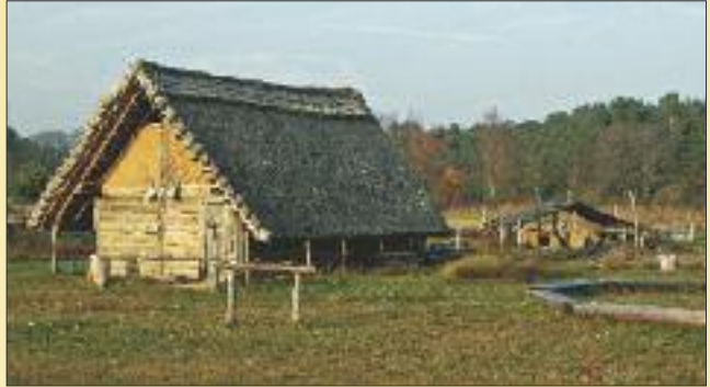
■ Die Germanische Siedlung in Klein Köris soll als Besuchermagnet ausgebaut werden.