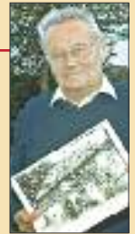
Orts-Chronist S. 24-25