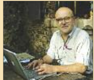
Künstler geht auf die Barrikaden S. 10-12