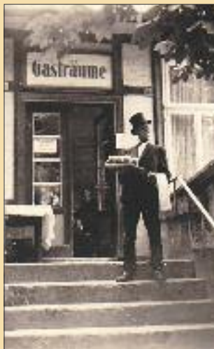
■ Im Februar 2012 blickt der Traditionsverein auf 100 Jahre Fastnacht in Groß Körös zurück.