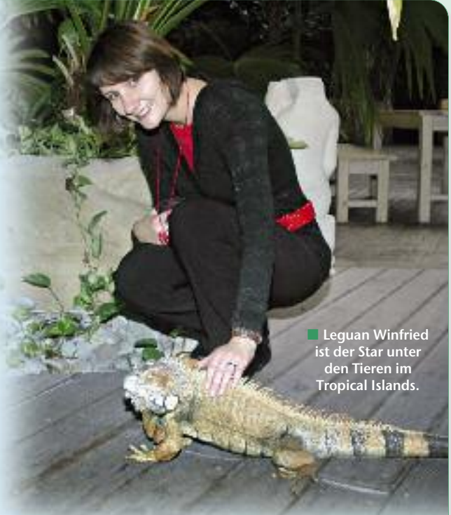
■ Leguan Winfried ist der Star unter den Tieren im Tropical Islands.

Wer in Brandenburgs tropischem Regenwald auf Safari geht, taucht in eine Tier- und Pflanzenwelt ein, die sich ganz natürlich entwickelt.