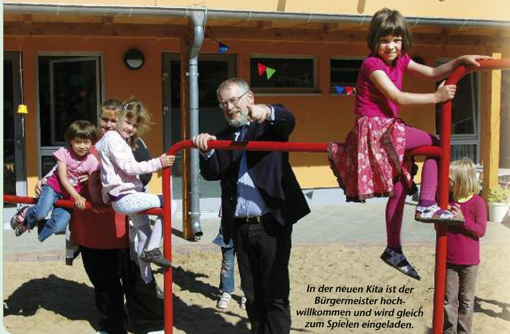
In der neuen Kita ist der Bürgermeister hochwillkommen und wird gleich zum Spielen eingeladen.

Wer dem Kita-Alter entwachsen ist, auf den wartet die Schule. Die Robinson-Grundschüler können sich nun ebenfalls freuen: Der mit Mitteln des Konjunkturpaketes II sanierte Hort im markanten Blau wartet ab dem neuen Schuljahr 2010/11 auf seine Gäste. Das Haus musste ja bekanntlich von einem Tag auf den