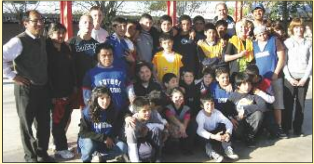
Wo erst Vorbehalte waren, entstanden Freundschaften, die immer noch gepflegt werden.

Das Projekt war Teil einer demokratischen Neuausrichtung der Schule. So wurden Schülerräte gebildet, die aktiv ins Schulleben einbezogen werden. „Die Schüler erarbeiteten eine Selbstverpflichtung, die die bisherige Hausordnung ersetzt. Sie wurde zur Abstimmung vorgelegt. 85 Prozent unterschrieben sie“, so der Schulleiter. Die neue „Kuschel-Schule“ setzt aufs