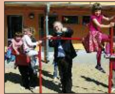
In Bewegung S. 6-8