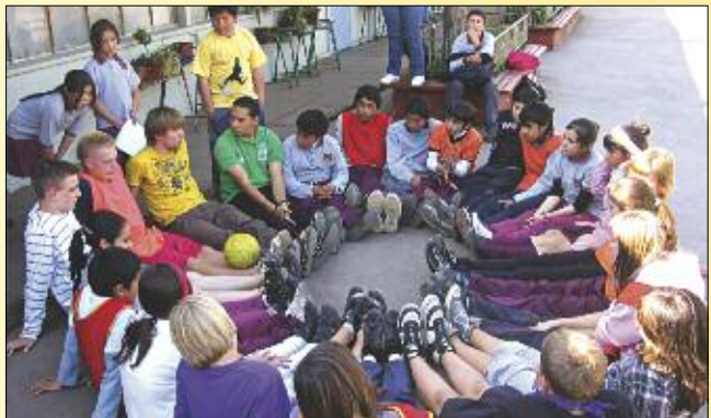
In Chile kamen sich Brieselanger und Kinder aus den Armenvierteln näher.

www.oberschule-brieselang.de Tel. 03 32 32/4 14 10