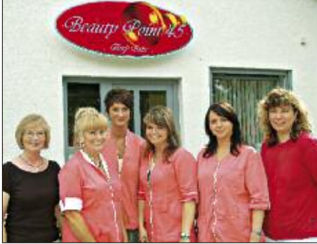
Gern stellt das Team von Beauty Point 45 ein individuelles Wohlfühl-Programm zusammen.

F rauen haben erfahrungsgemäß das eine oder andere süße Geheimnis. Dazu gehört in Brieselang eine natürliche Schönheitsbehandlung, die teilweise auf Erfahrungen aus dem Reich der Pharaonen zurückgeht. Schon die sagenumwobene Königin Kleopatra half bei ihrer Schönheit mit regelmäßiger