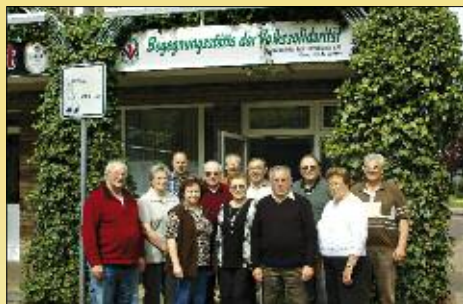
Die Begegnungsstätte am Markt ist ein beliebter Treffpunkt.

„Wir kommen zusätzlich jeden Montagnachmittag nach Brieselang in die Begegnungsstätte, beraten hier über alles rund um die