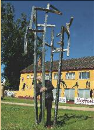
Dieses Kunstwerk hat es Brieselangs Bürgermeister angetan, er will es am liebsten für die Gemeinde kaufen.