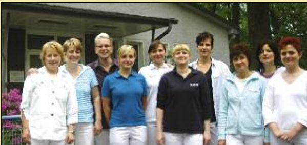
Ein freundliches Team unterstützt die Ärzte in ihrer Arbeit.