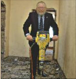
Bürgermeister Wilhelm Garn engagiert sich kraftvoll für den Ort.