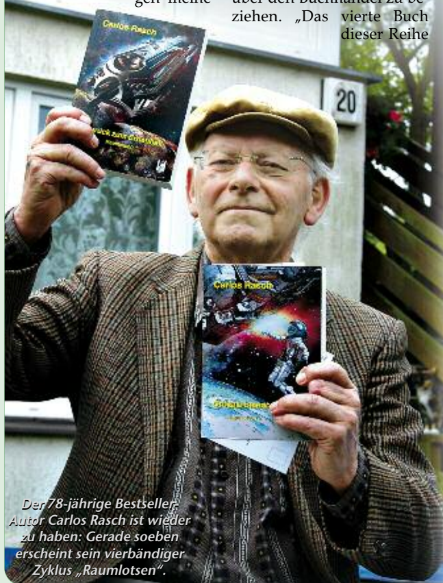
Der 78-jährige Bestseller-Autor Carlos Rasch ist wieder zu haben: Gerade soeben erscheint sein vierbändiger Zyklus „Raumlotsen“.