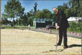
Damit die kleinen Kicker schneller loslegen können, greift der Bürgermeister schon mal selbst zur Harke, um den Baufortschritt für das Kleinfeld zu beschleunigen.