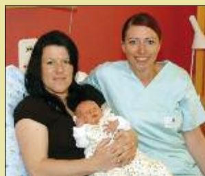
Im neugestalteten Kreißsaal sorgen warme Töne für eine entspannte Atmosphäre.