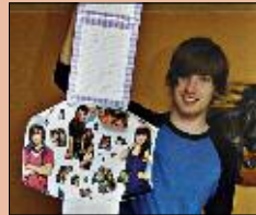
Mädchen-Schwarm . . . . . S. 12-13