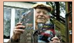
Weltraum ganz neu S. 11