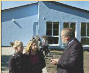
Die Schulkinder können sich über den neuen Hort freuen.