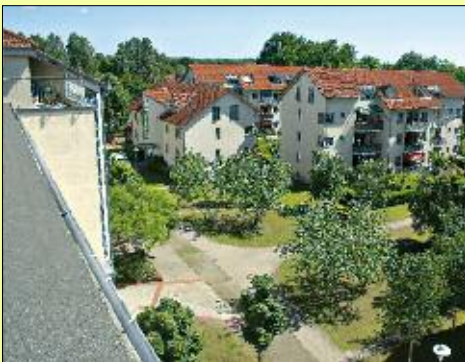
Das gepflegte Wohnumfeld ist ein ansprechender Rahmen für den 50. Jahrestag der Wohnungsgenossenschaft „Birkengrund“ im Sommer 2010.

Als vor 50 Jahren die Gründung beschlossen wurde, konnte wirklich keiner wissen, wie