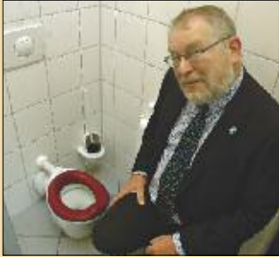
Brieselangs kleinste Toilette ist eine große Sehenswürdigkeit für die Erwachsenen. Die Kinder packen gerne in ihrer Kita mit an.

anderen geschlossen werden da eine „hohe Naphtalin-Belastung“ festgestellt wurde. Im Gebäude daneben wird noch kräftig gearbeitet. Der Flachbau wird nach der Sanierung, die auch mittels der Konjunkturmittel erfolgt, der Hans Klakow Oberschule wieder für Arbeitskunde und Kochunterricht zur Verfügung stehen. „Teilweise wurden damals einfach Steine auf den Sand gestellt und aufs Fundament verzichtet“, wundert sich Wilhelm Garn über die Bauweise.