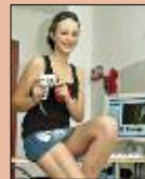
Kämpferisch und sexy S. 22-23