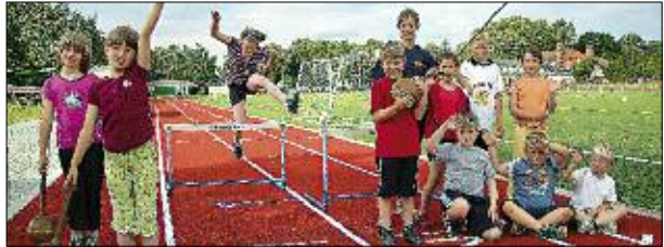
Beim Leichtathletik-Training nutzen die Kinder die Vorzüge des neuen Sportplatzes.

Das gilt ohne Altersgrenzen und deshalb ganz besonders auch für Kinder und Jugendliche. Die haben Katja und Andreas Senger beispielsweise mit Leichtathletik besonders im Blick. „Kinder mit Spaß an der Bewegung sollen einfach vorbeikommen.“ Allein bei der Leichtathletik treffen sich 48 Kinder in verschiedenen Gruppen auf dem Sportplatz. Die neue Laufbahn wirkt sich prima auf die Motivation aus. „Wir ergänzen hier den Schulsport unter dem Aspekt des Ge-